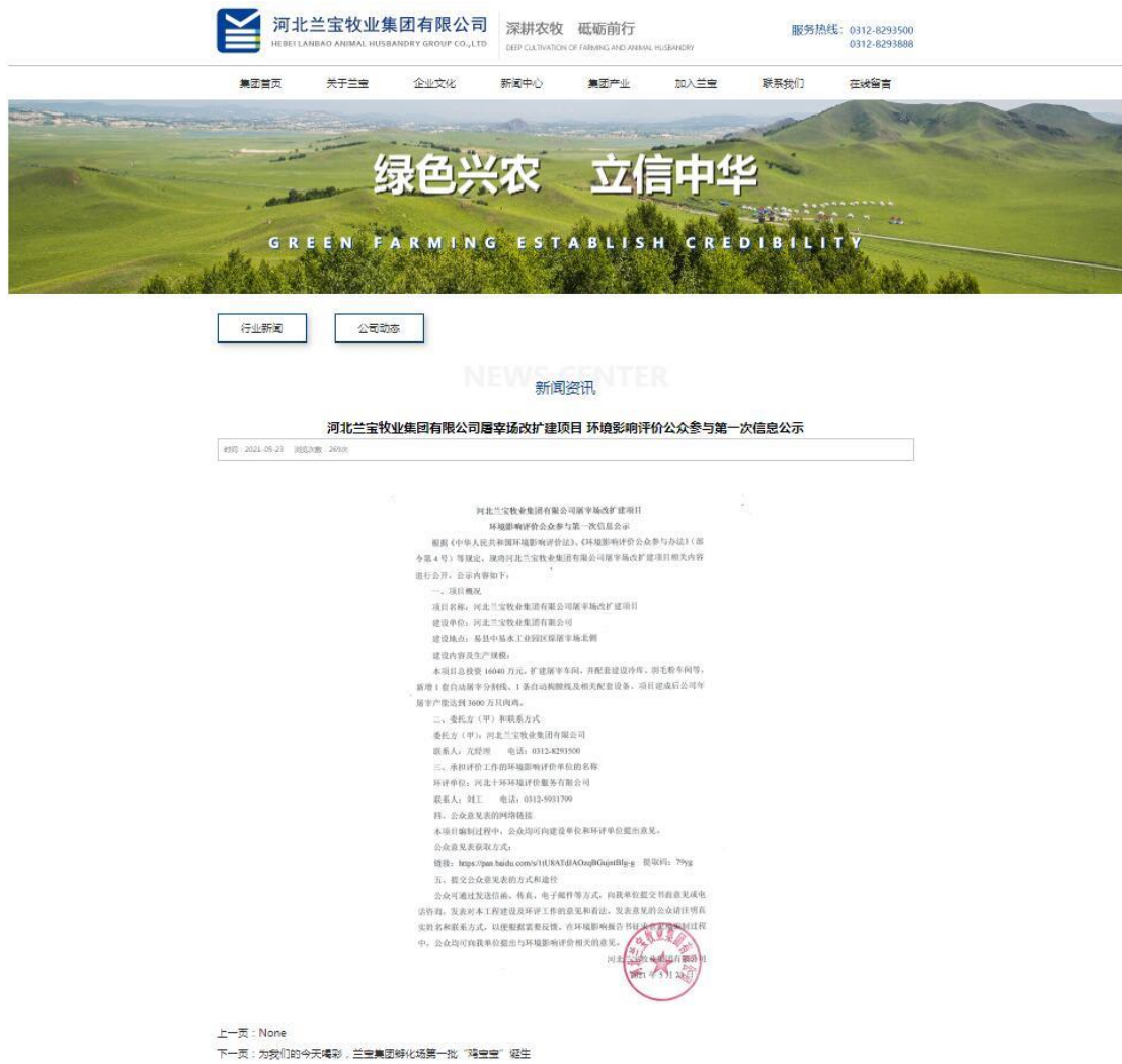
图 2-1 网络平台公示情况